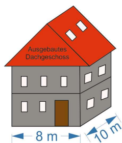
8 m x 10 m x 3 Stockwerke = 240 m 2 Geschossfläche

Bei unbebauten Grundstücken wird zunächst eine fiktive Geschossfläche angesetzt. Diese beträgt lt. BGS/WAS 40% der Grundstücksfläche. Wird ein solches, bisher als unbebaut veranlagtes Grundstück bebaut, wird die nun tatsächlich vorhandene Geschossfläche berechnet (es wird von Außenmauer zu Außenmauer gerechnet) und mit der bisher veranlagten Geschossfläche verrechnet. Dies kann zu Erstattungen bzw. zu Nacherhebungen führen.